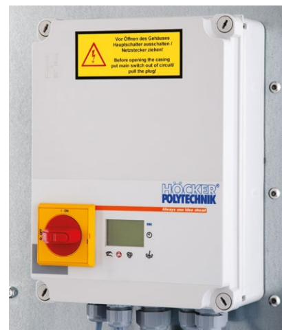
Fig. droite: Commande par automate programmable avec un affichage solide et un extincteur automatique