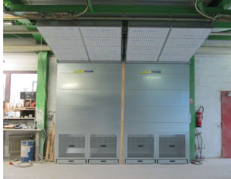
III. : Deux DustStars en action (avec accessoire spécial)

Étendue de la livraison : le DustStar est livré en trois parties faciles à assembler, armoire de commande, câble d'alimentation de 5 m, manuel d'utilisation inclus